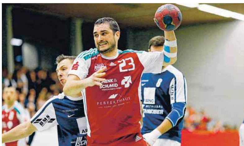
HRW Laupheim (am Ball) reist nach Ostfildern.